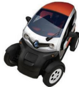
③ Quadricycle léger